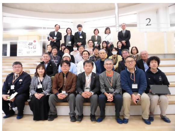
▲五中のシンボル「五中ステップ」にて

今年の4月から設置された、学校運営協議会の機能を有する、新しい「開かれた学校づくり協議会」。五中与密接な関わりをもつ、第五小学校と関前南小学校の協議会と、現在までの活動内容などについて共有しました！どの学校も「自分たちの学校を良くしたい」、「地域を盛り上げたい！」と奮闘していました。今後の五中開かれた学校づくり協議会の運営に役立てていきたいと思います。